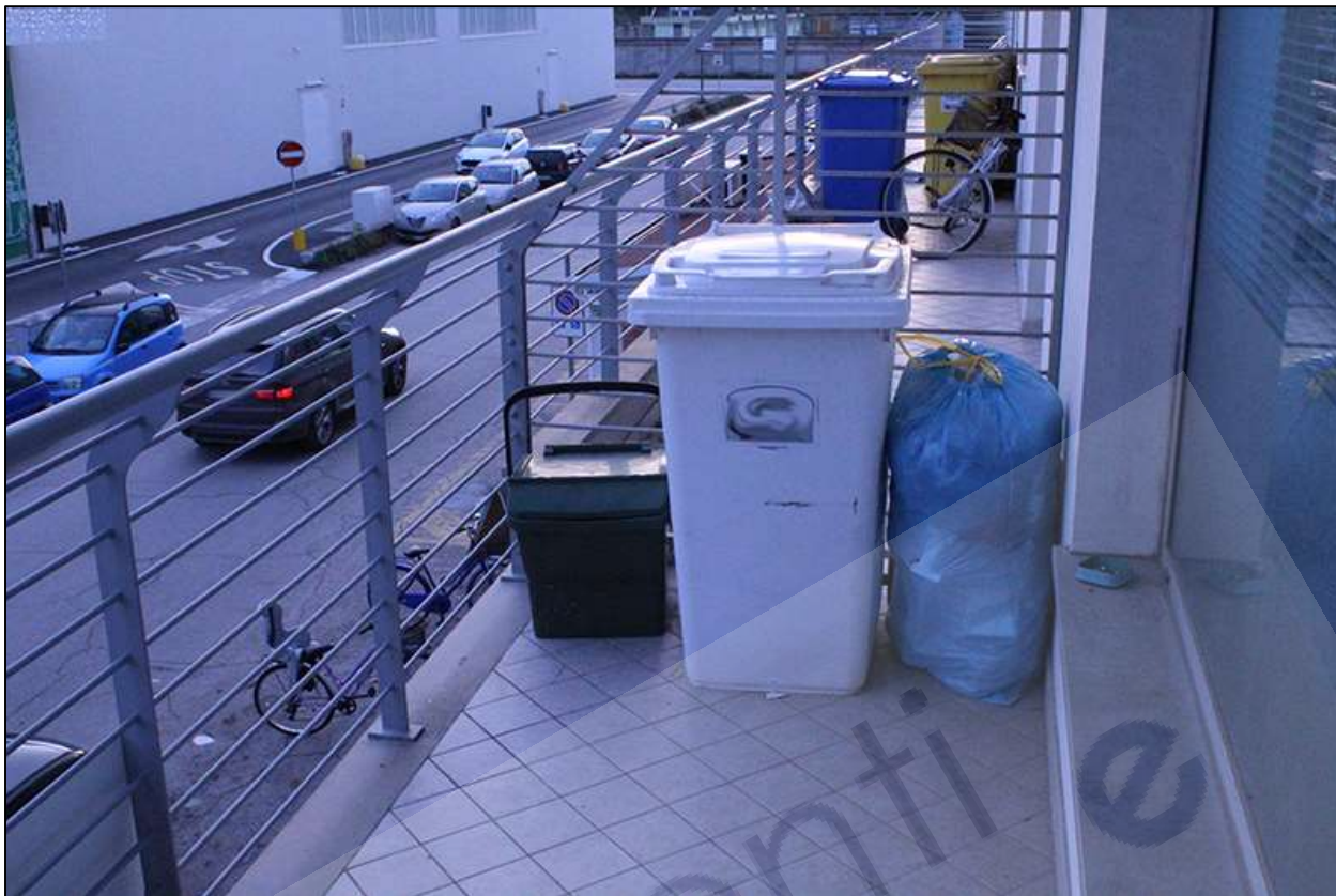
Foto n.7- Balcone sub.39