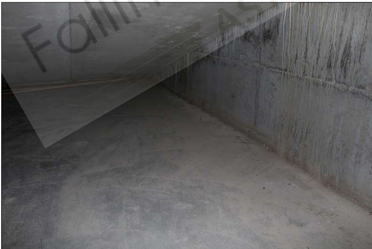
Foto n.10- Vano del sub.24 ricavato sotto rampa d'accesso