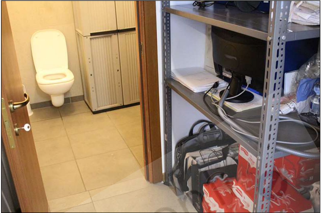
Foto n.5- Antibagno