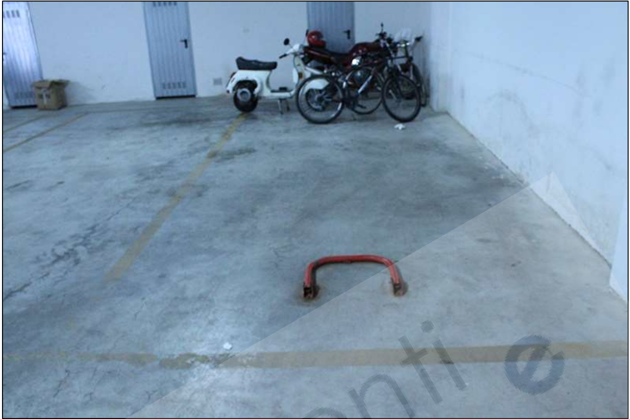
Foto n.11- Posto auto sub.23