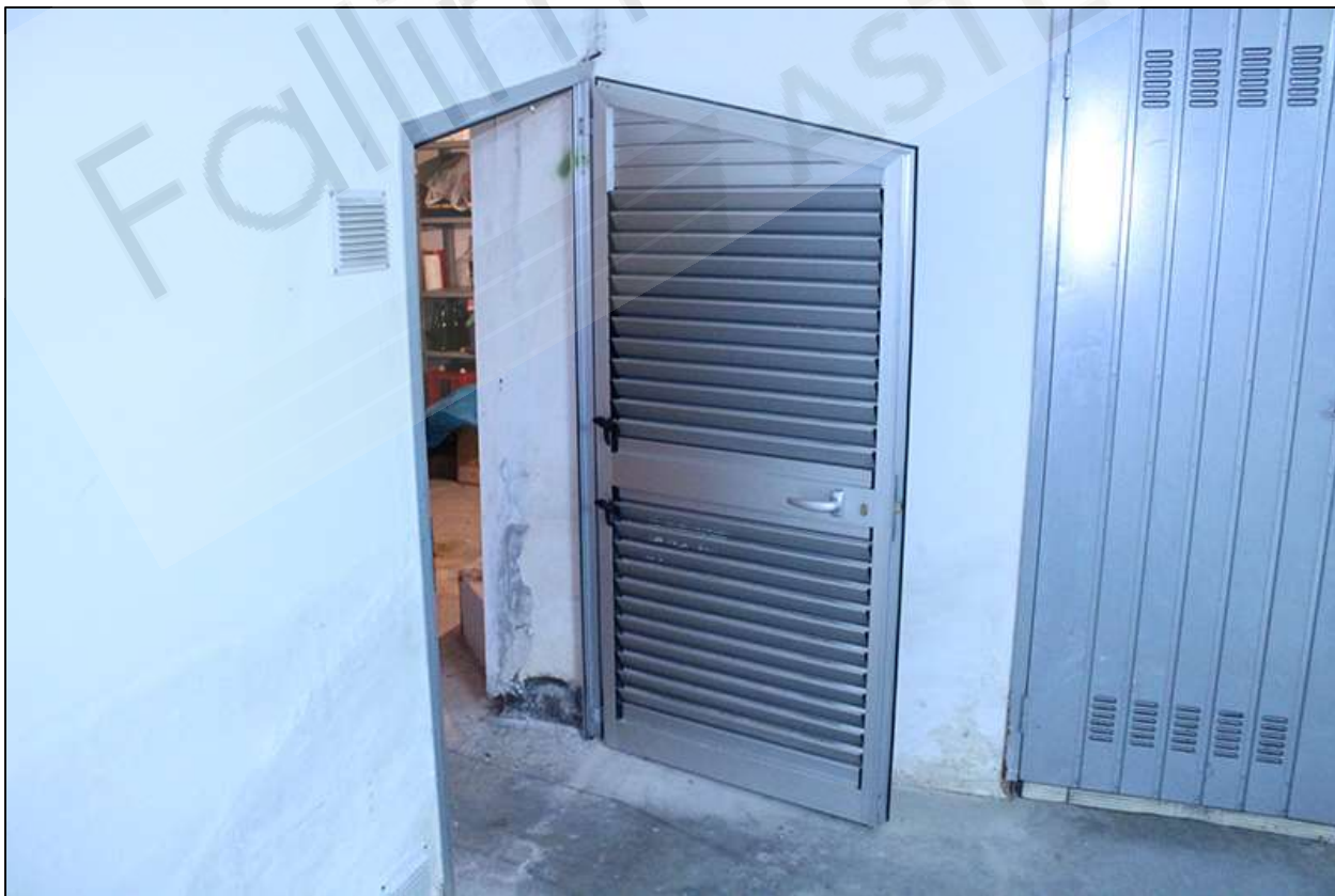
Foto n.8- Ingresso ripostiglio sub.24