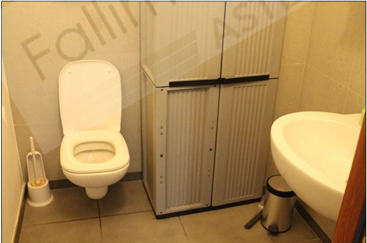
Foto n.6- Bagno sub.39