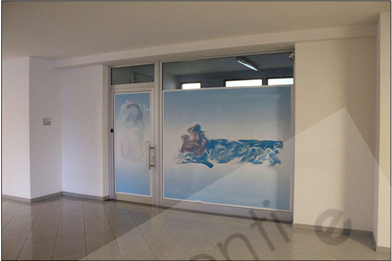
Foto n.1- Accesso al sub.39 da vano scala condominiale