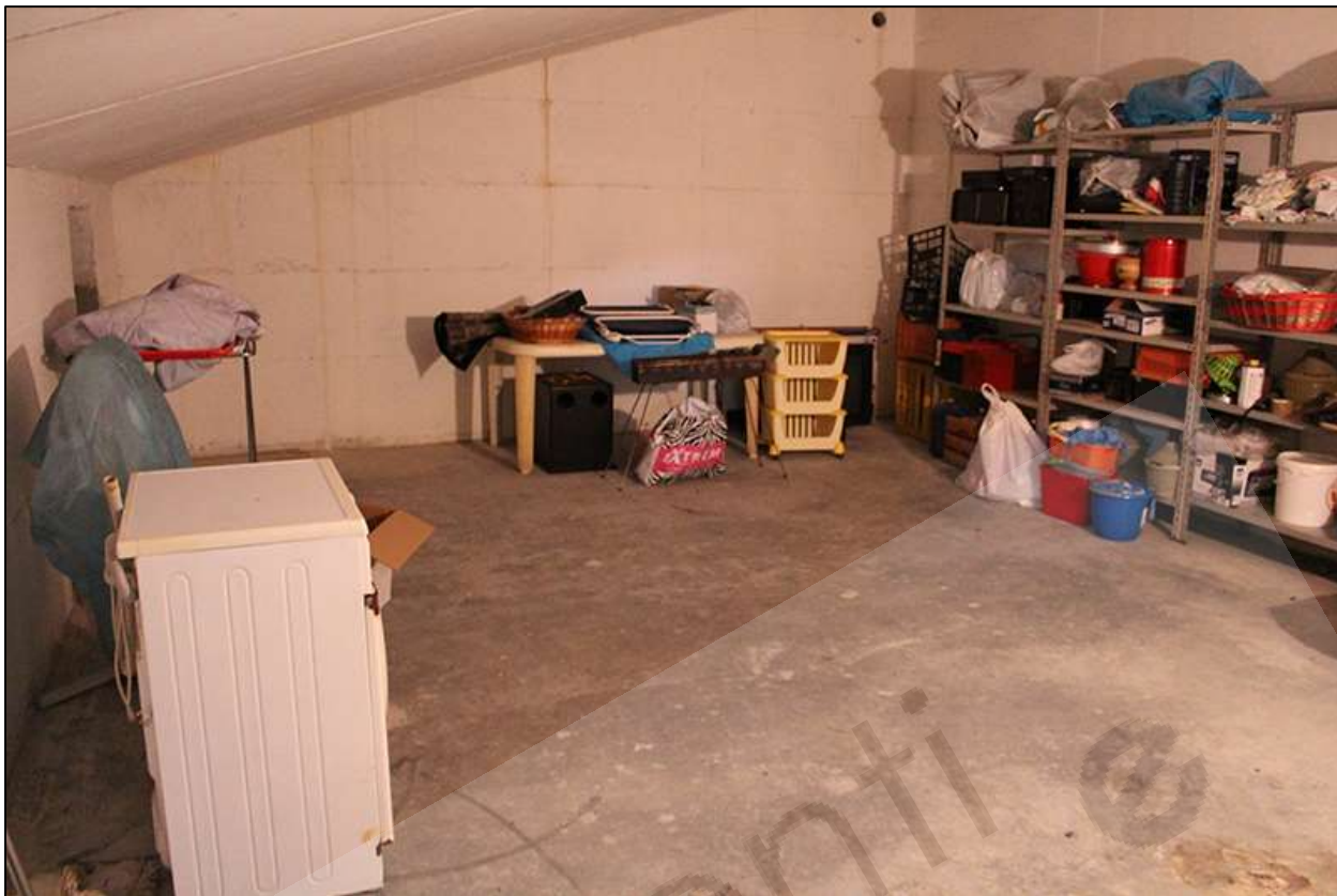
Foto n.9- Interno ripostiglio sub.24