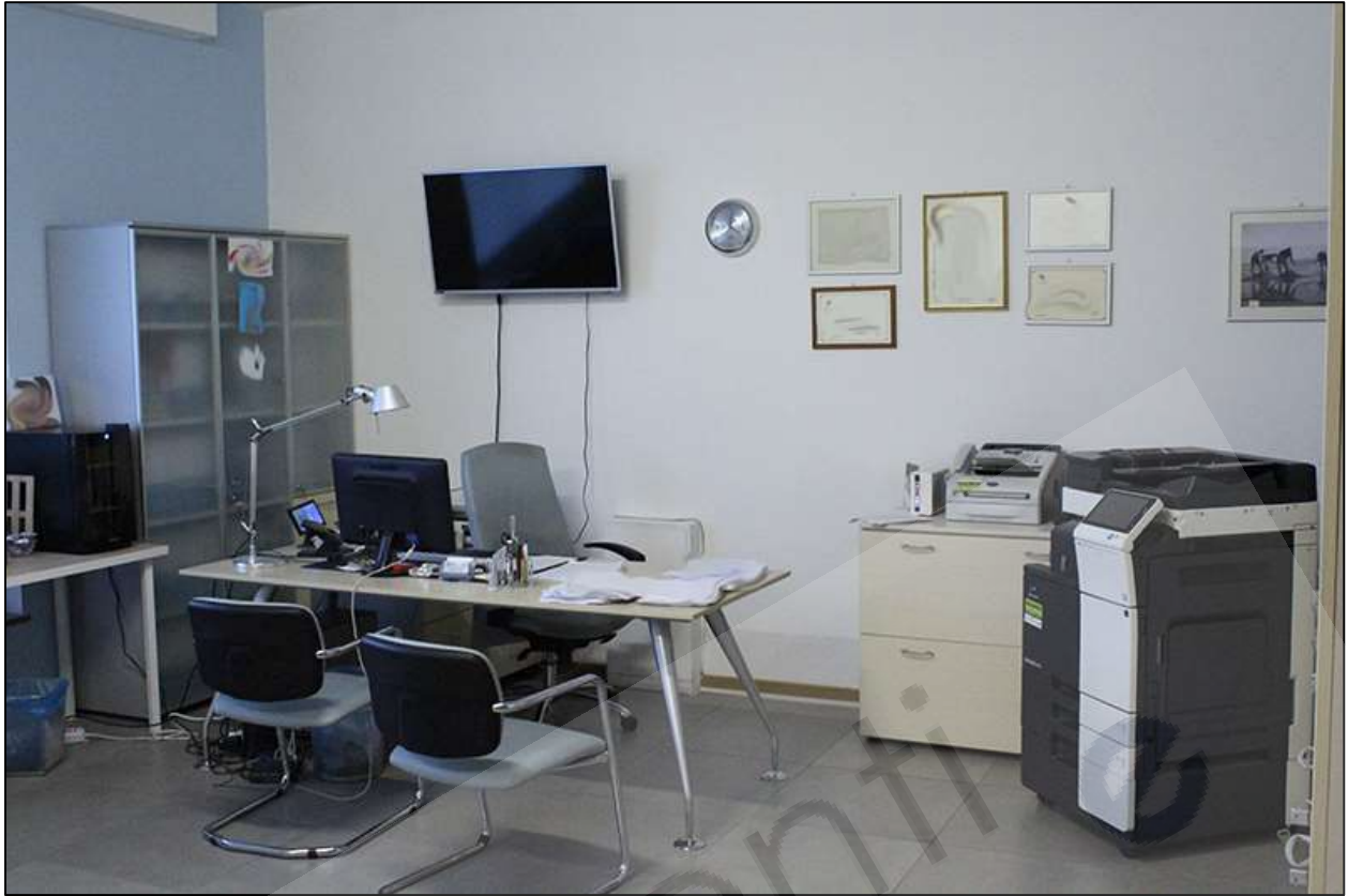
Foto n.3- Ufficio sub.39