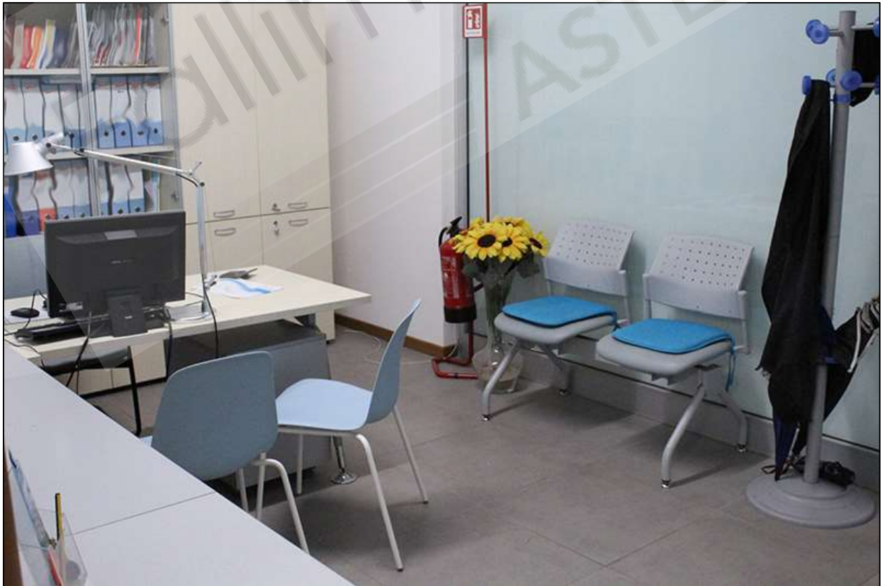
Foto n.2- Ingresso ufficio sub.39