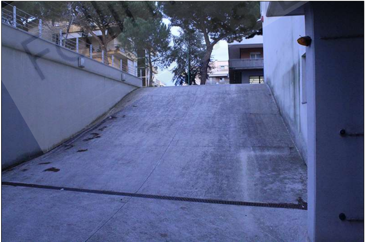
Foto n.12- Rampa carrabile al piano S1