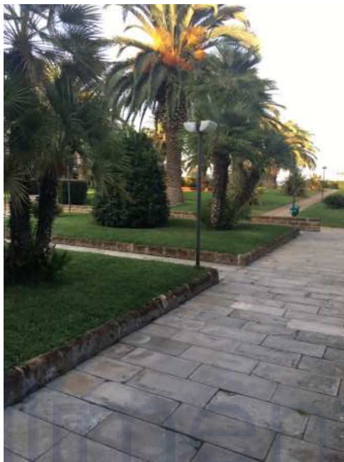
Foto n.5 – Vista del cortile interno condominiale di collegamento al mare