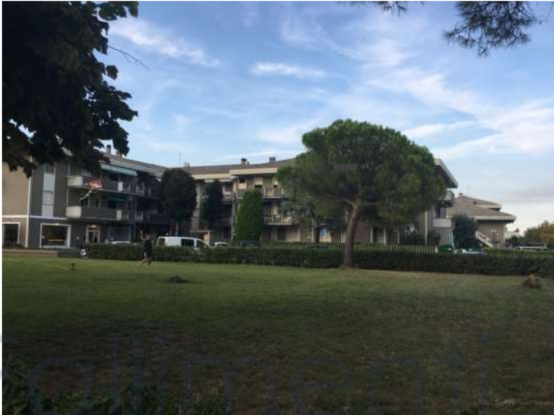
Foto n.1 - Vista esterna del fabbricato - Area pertinenziale