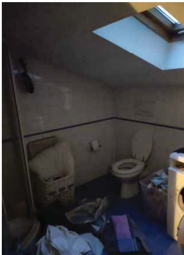
Foto n.27- Bagno