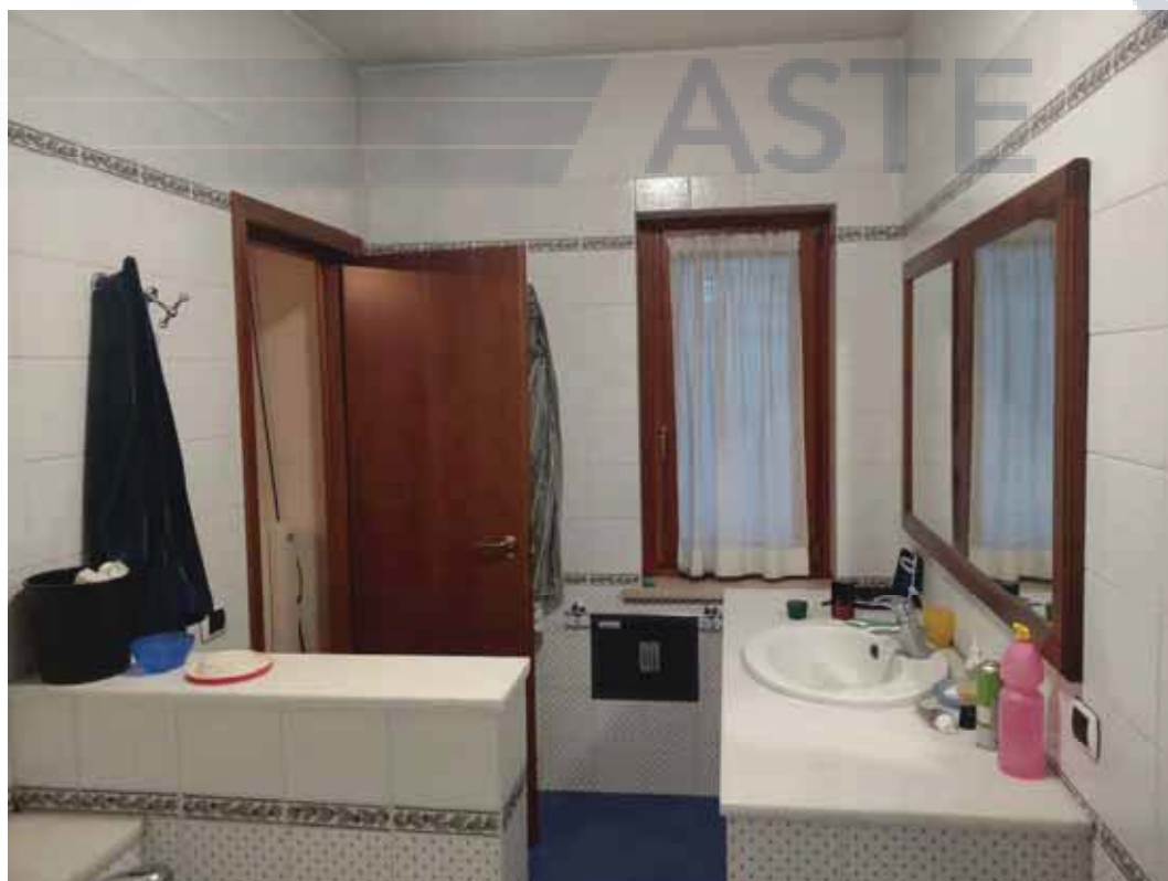
Foto n.20- Bagno