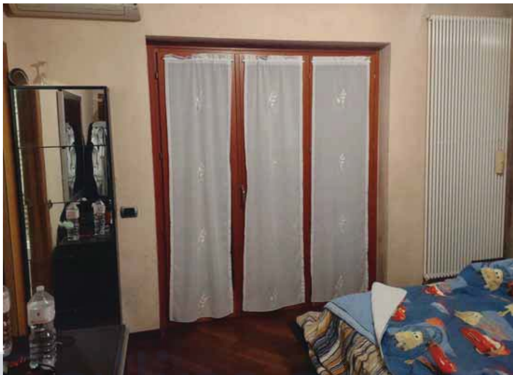
Foto n.21- Camera