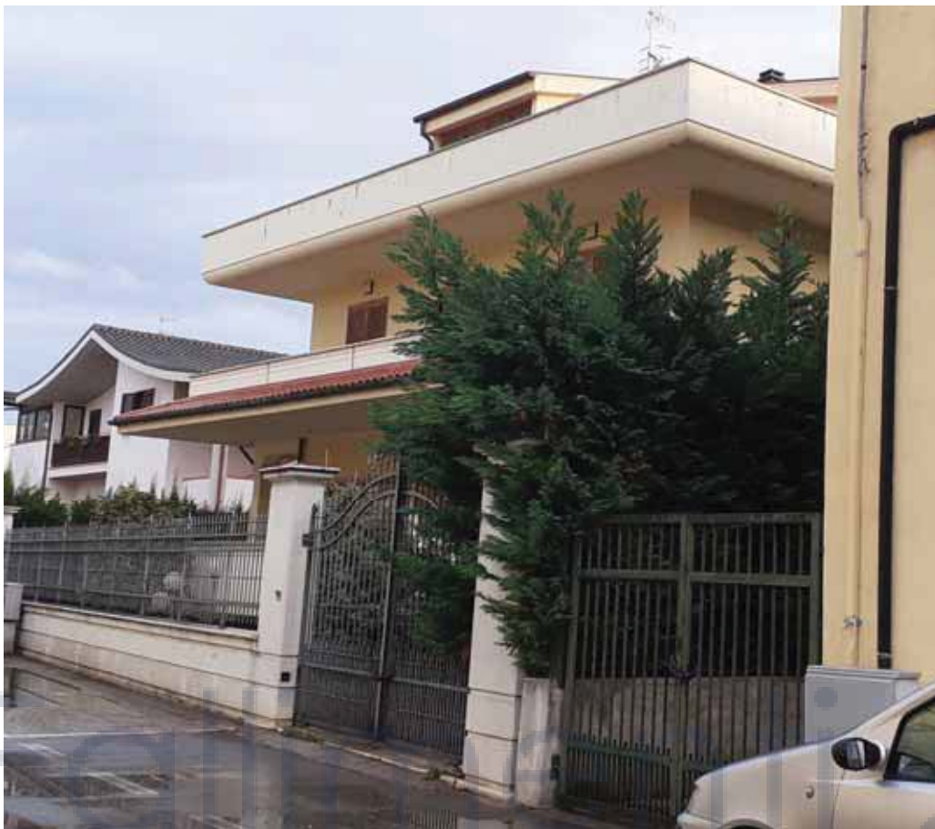
Foto n.3- Lato nord-ovest, con accesso al garage