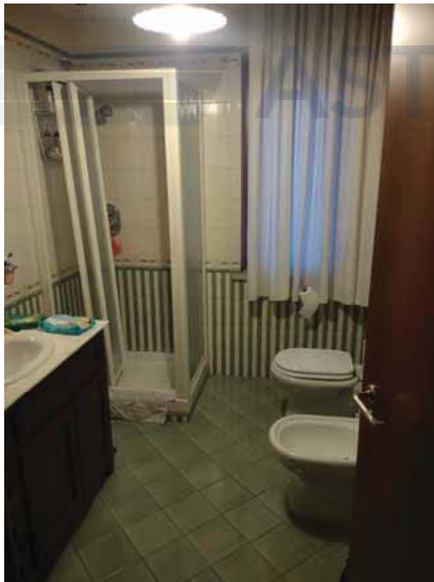
Foto n.18- Bagno