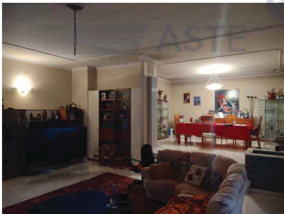
Foto n.10- Soggiorno e salotto