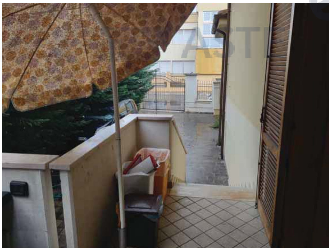
Foto n.8- Accesso al terrazzo ovest