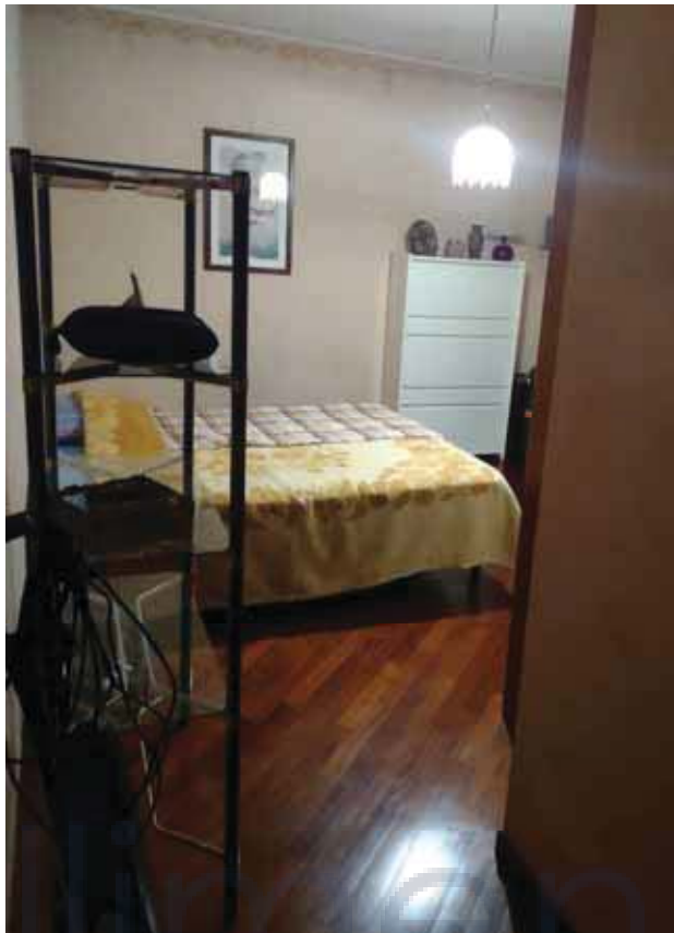
Foto n.17- Camera