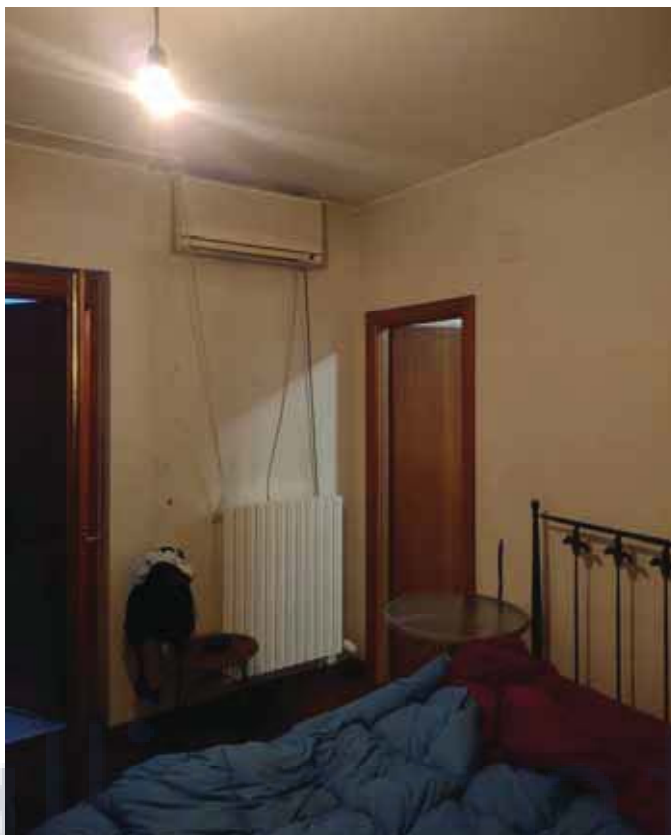
Foto n.19- Camera