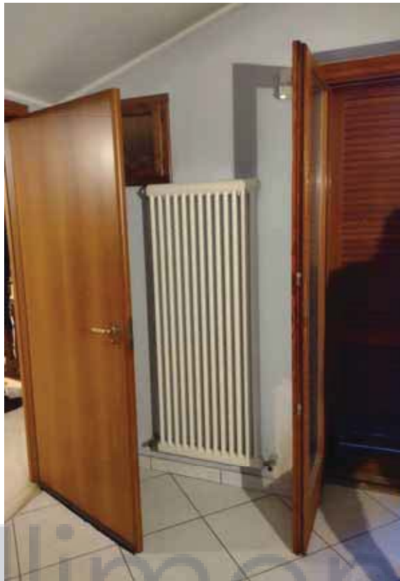
Foto n.25- Accesso al sottotetto