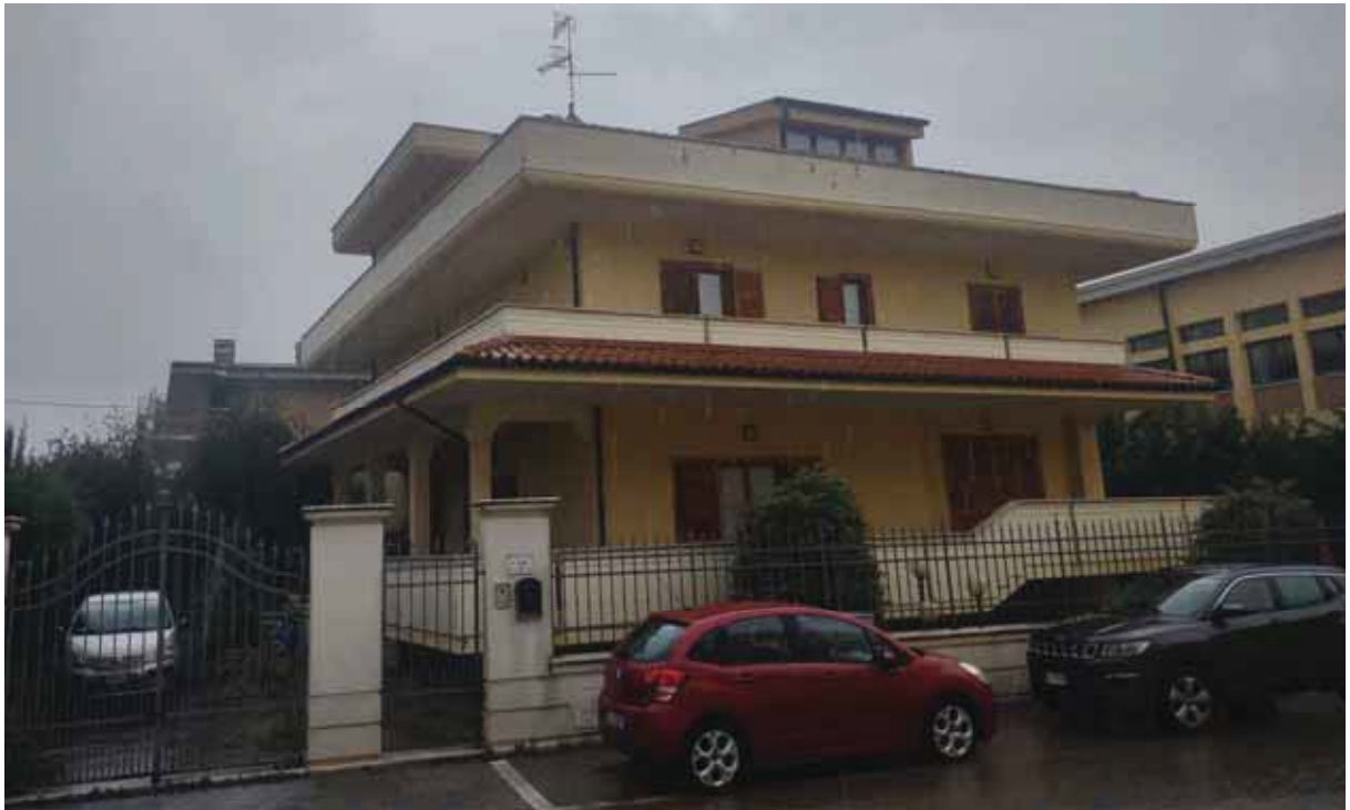
Foto n.1- Vista lato nord-est