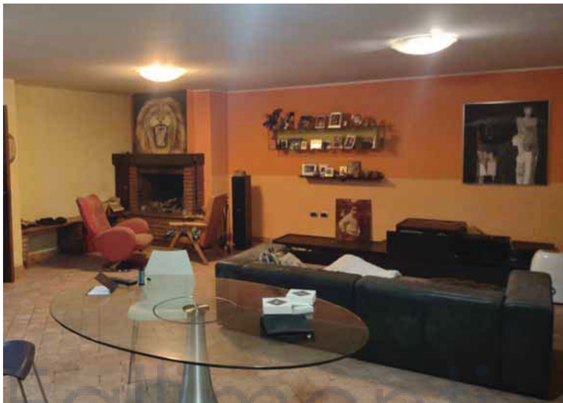
Foto n.5- Taverna con camino