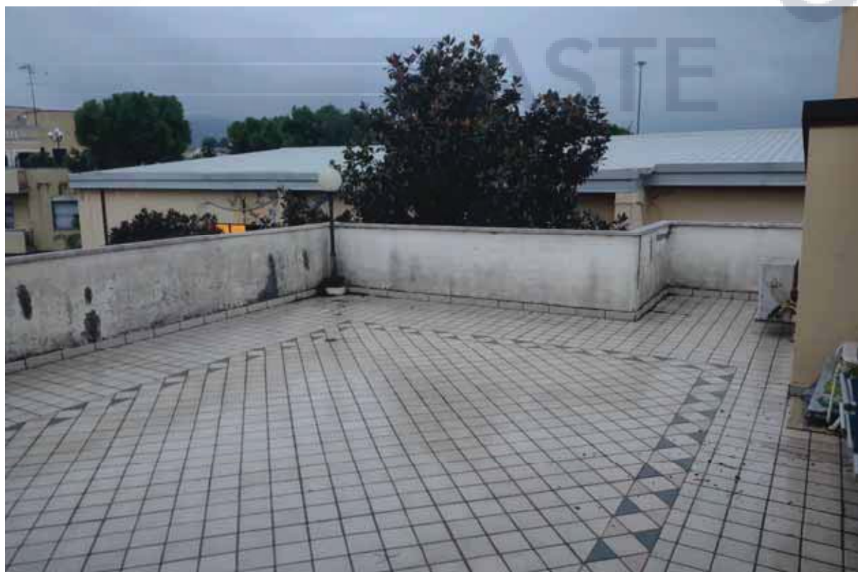
Foto n.28- Terrazza