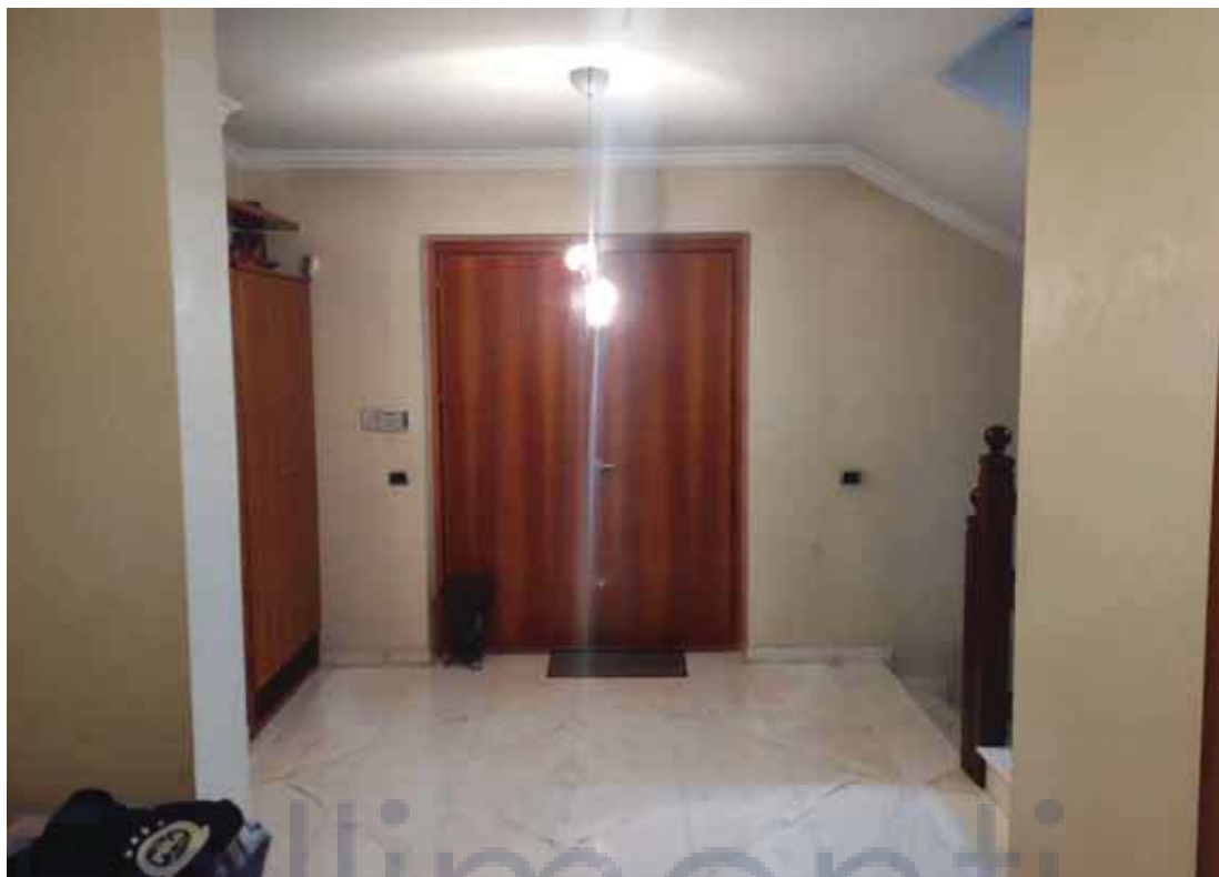
Foto n.9- Ingresso al piano terra