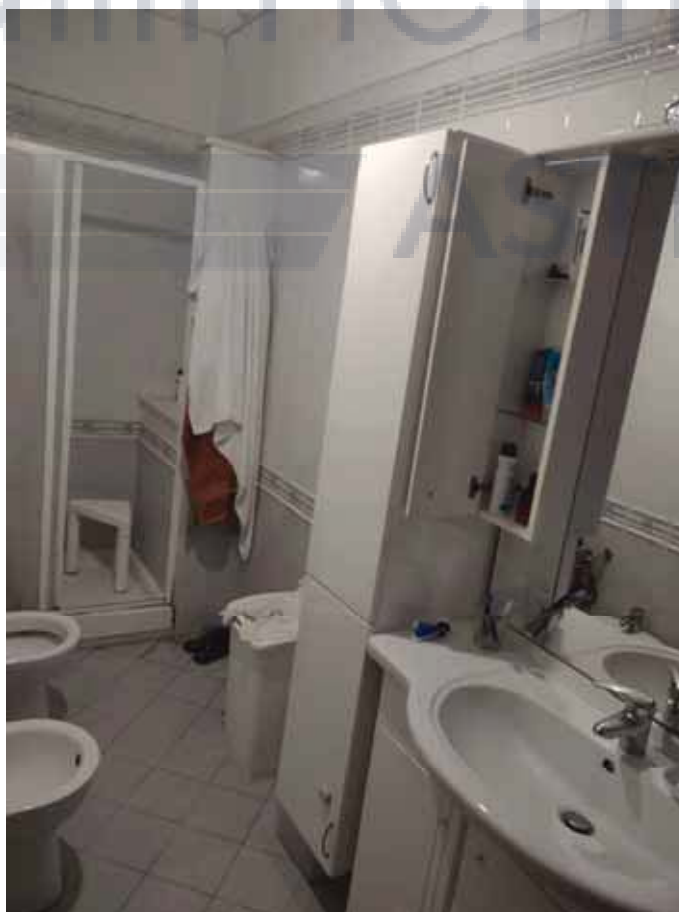
Foto n.22- Bagno