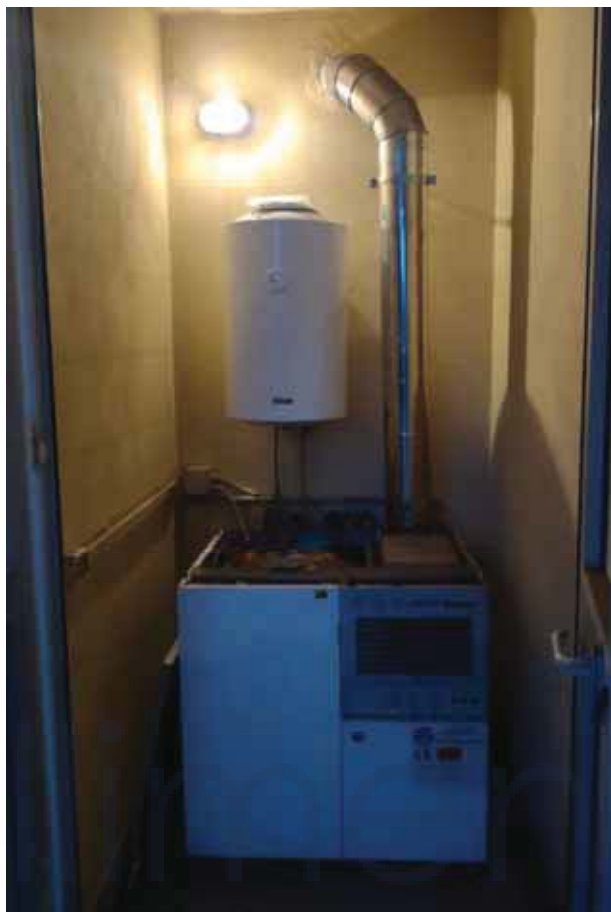
Foto n.23- Caldaia a gas