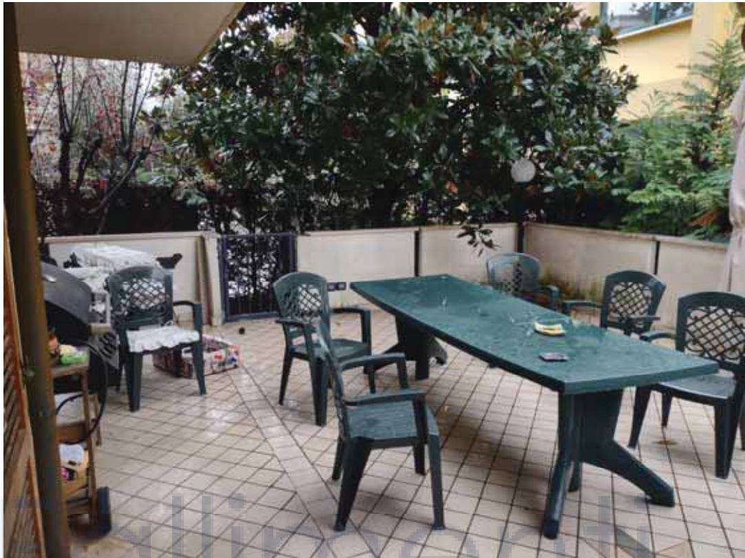
Foto n.15- Terrazza ovest