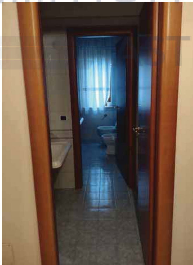
Foto n.12- Bagno e anti