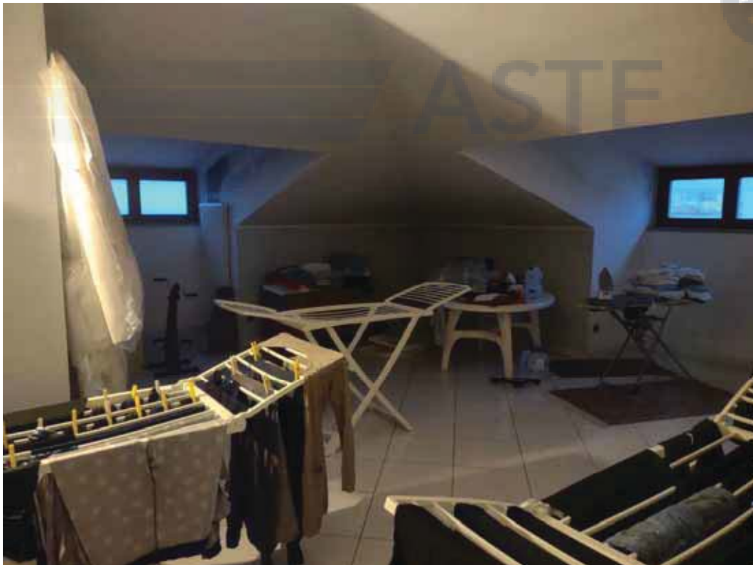
Foto n.26- Lavatoio-stenditoio