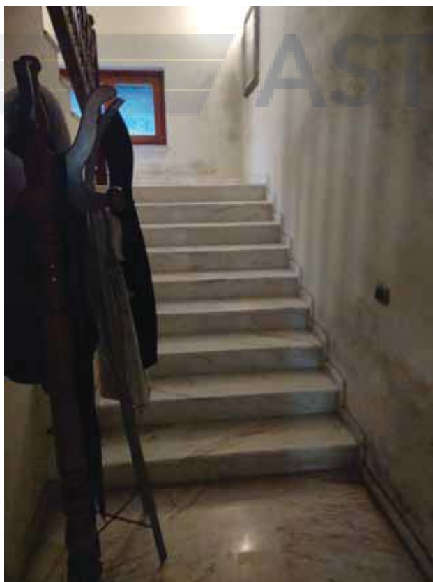
Foto n.4- Accesso al seminterrato