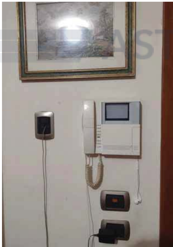
Foto n.14- Videocitofono