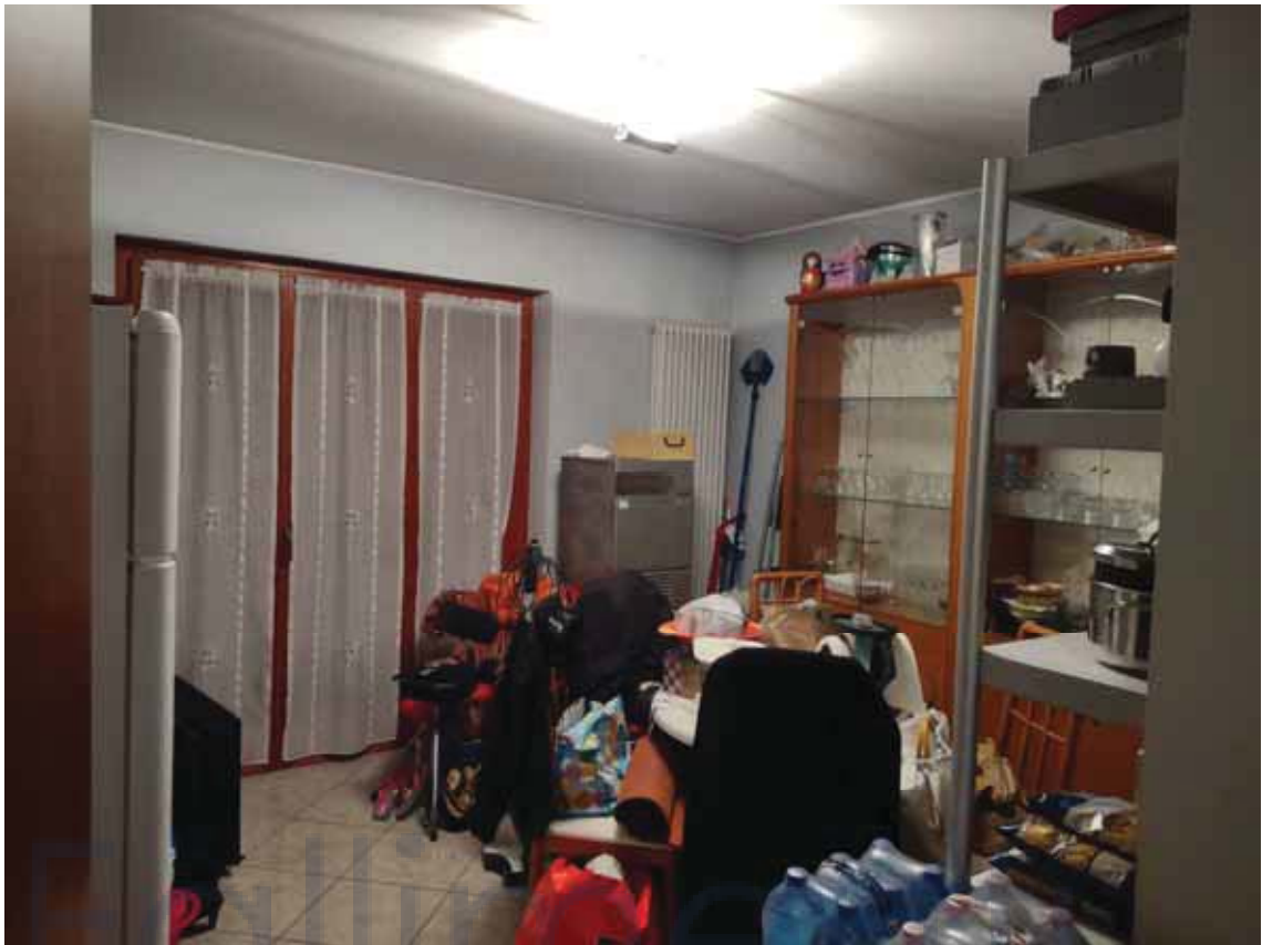
Foto n.13- Locale al p.t.