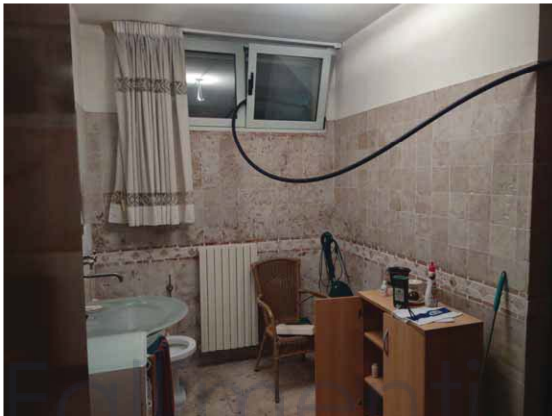
Foto n.7- Bagno