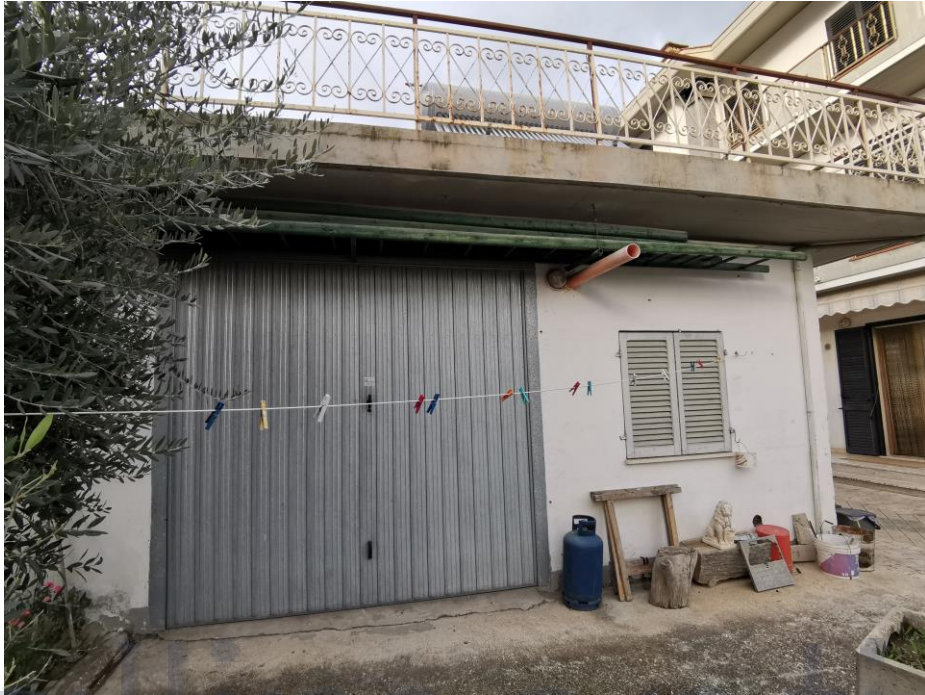
IL MANUFATTO LEGNAIA RIPOSTIGLIO